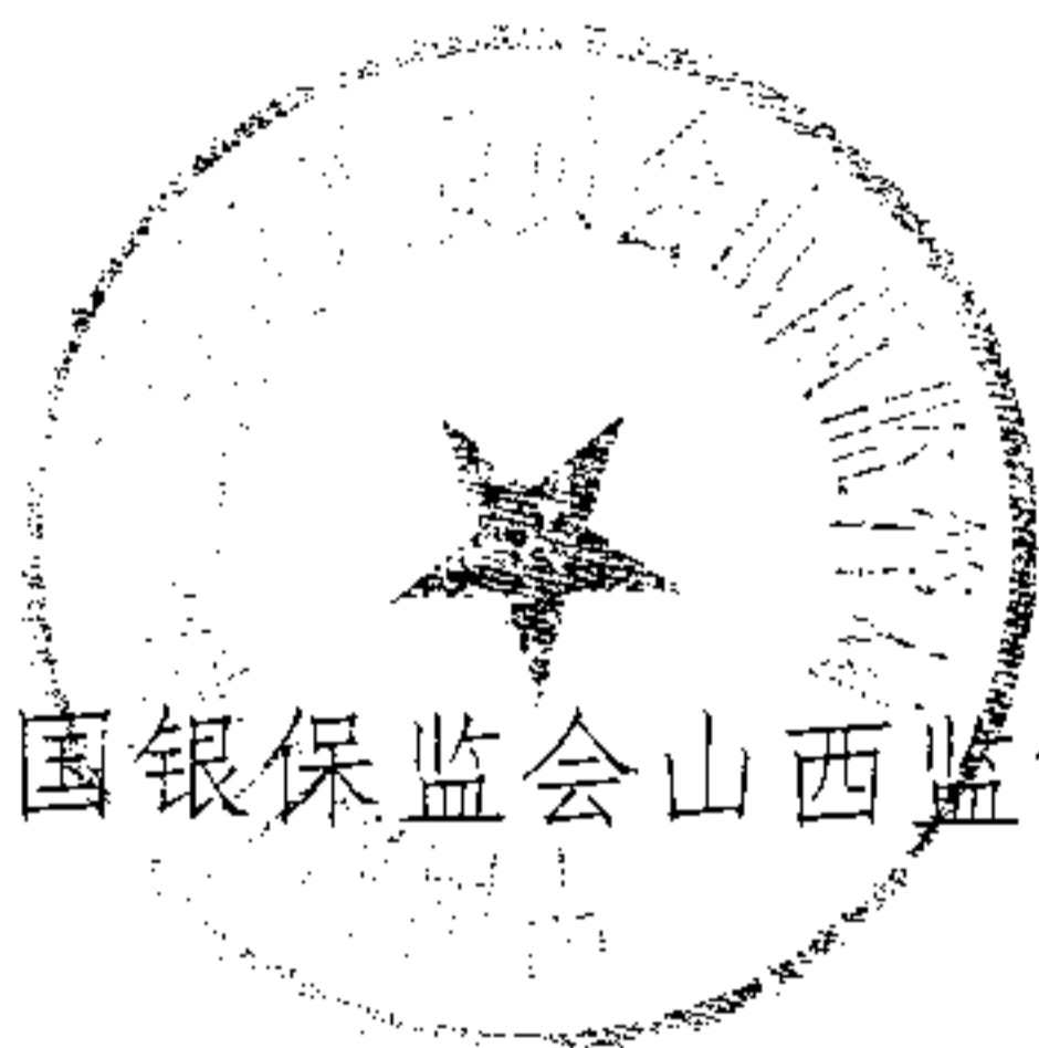
中国银保监会山西监管局