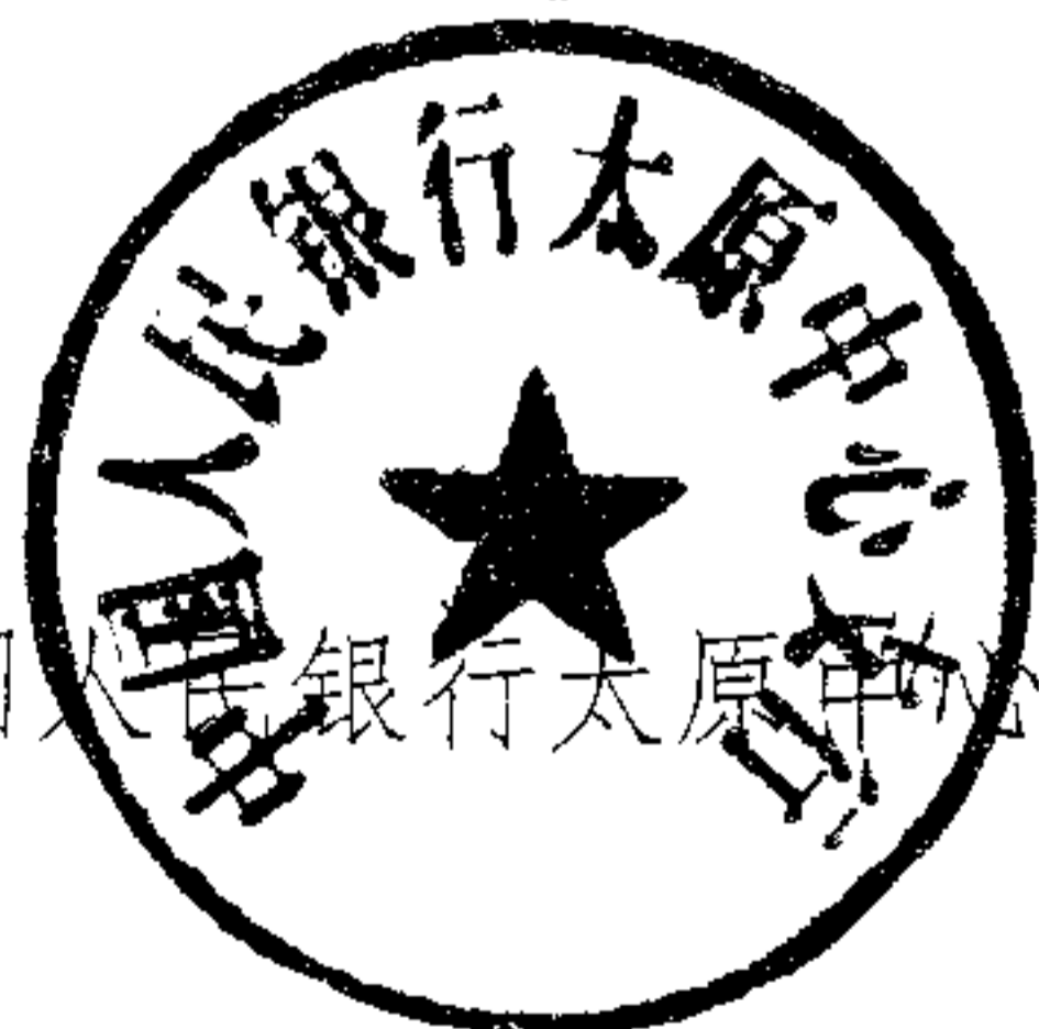
中国人民银行太原中心支行